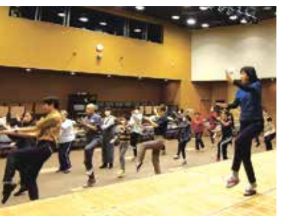
イベントのイメージ