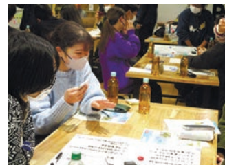
過去のワークショップの様子