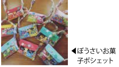
◀ぼうさいお菓子ポシェット

■親子deぼうさい講座「ぼうさいお菓子ポシェットをつくらう!」 災害の避難時に役立つお菓子を入れたポシェットを作りながら、防災について楽しく学びます。 ③ 3月9日(出)10時～11時半 ④ 15組※令和5年度に4歳になる子～小学生と保護者 ⑤ 500円 ⑥ 往復はがき・メール：2月24日(出)必着 ⑩ 1037013