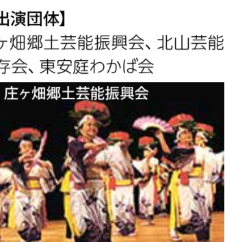
庄ヶ畑郷土芸能振興会、北山芸能保存会、東安庭わかば会