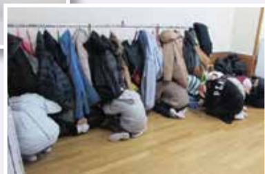
杜陵小で避難行動をとる児童▶