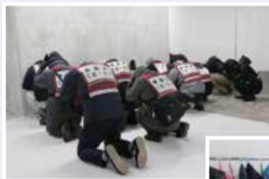
◀もりおか歴史文化館で頭部を守る訓練参加者

もりおか歴史文化館や盛岡城跡公園地下駐車場、杜陵小を会場に、国・県・市共同による弾道ミサイルを想定した住民避難訓練を、県内で初めて開催しました。訓練用の全国瞬時警報システム(Jアラート)の鳴動を合図に避難を開始。どの参加者も引き締まった表情で、窓から離れた場所や地下に移動して頭部を守るなど、万が一に備えた行動を確認しました。