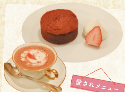
愛されメニュー ●季節のホットチョコレート ●季節の菓子

季節ごとに変わるメニューや、お菓子・チョコレートに合わせたコーヒーは、こだわりぬいた味と店員さんの温かい思いを感じられます。