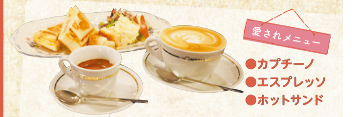
愛されメニュー ●カプチーノ ●エスプレッソ ●ホットサンド