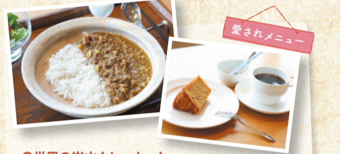
愛されメニュー ●世界の岩山カレーセット (カレー、シフォンケーキ、黒千石大豆コーヒー)

シフォンケーキの米粉・雑穀・みそ、コーヒーの黒千石大豆は県産食材を使用。黒千石大豆は栄養価が高く、豊かな風味が味わえます。