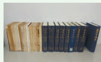
過去に刊行した盛岡市史・通史

ん事業では、これらの市史・村誌の編さんの成果を踏まえ、その後の時代を切れ目なく網羅できるよう、おおむね昭和30年代から平成の終わりまでの約60年間を対象期間とし、昭和20年代の戦後の新たな時代背景なども加えながら、新たな市史として通史編・資料編・写真集の編さんを進めてきました。