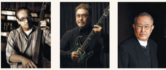
古野光昭 ©Shinichi Honda 渡辺香津美 ©Yosuke Komatsu (ODD JOB LTD.) 山下洋輔 ©Akihiko Sonoda