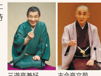
三遊亭兼好 古今亭文菊

明るく華やかな高座が人気の三遊亭兼好と、たたずまいやしぐさの演じ分けが巧みな古今亭文菊。丁々発止の口演にご期待ください。