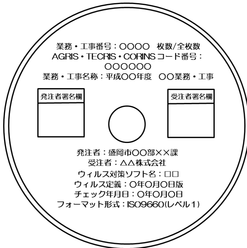
図 電子媒体の表記例(正副2部)