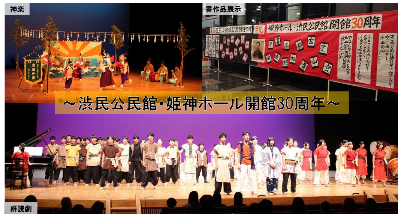
～渋民公民館・姫神ホール開館30周年～

10月25日（土）・26日（日）の2日間、盛岡市渋民公民館・盛岡市渋民文化会館（姫神ホール）（渋生字鶴塚55）を会場に、第20回玉山地域公民館まつりが開催されました。主催は、玉山地域公民館まつり実行委員会、好摩地区公民館、玉山地区公民館、薮川地区公民館及び渋民公民館。