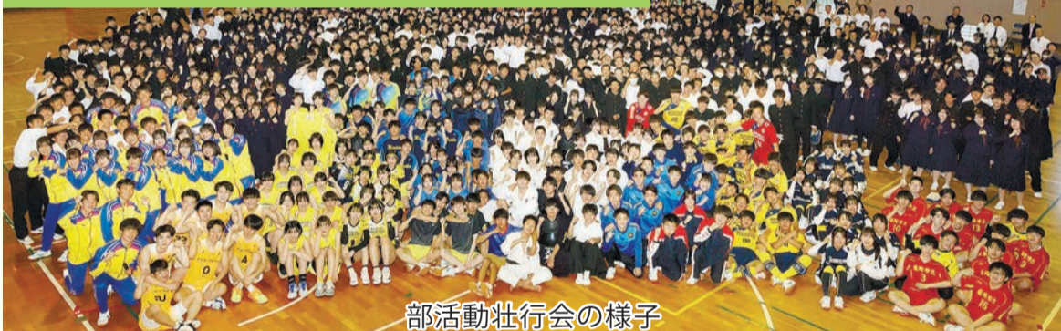
部活動壮行会の様子