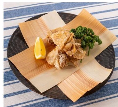
▲ 見た目にも美味しい経木

かつて鮮魚や精肉、おにぎりやお弁当を包むなど、人々の暮らしに欠かせない存在であった経木。吸湿性や保湿性が料理の美味しさを引き立て、木肌の美しさと香りが食卓に彩りや高級感を与えます。ローテク&ナチュラルな素材のため、環境負荷や健康への配慮、また時間に追われる現代の使い捨てニーズにもぴったり。名刺や文具、包装材など、経木を使った新たな製品の開発にも取り組み、経木の魅力と可能性を発信し、再び日常に取り入れる楽しさを伝えます。