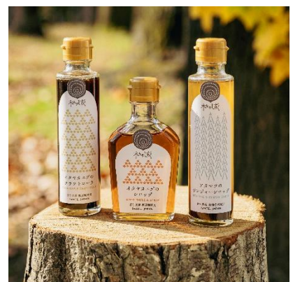
▲ 木の香りを活かしたシロップ