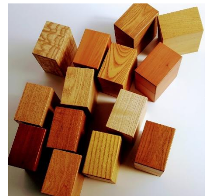
▲木目の自然な美しさが映える『いわてのてばこ』

岩手・盛岡は質量共に森林資源豊富な地域だが、生活様式の変化等で立派な原木が使い道もなくチップやマキにされてしまうという話を聞いたことがある。事実、名前も用途も不明の木を引き取ったことがある。『いわてのてばこ』そして『木のいろ はがき額』は試作以来、今迄使いかねていた木も意識的に使う様にしてきた。見る、触る、知る（名と用途を）、使う—岩手・盛岡の多彩な森の木の価値を改めて見直す、手仕事による小さな木工品をこれに続けて作り続けていきたい。