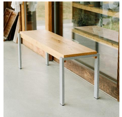
▲ シンプルなデザインと使いやすさを兼ね備えたベンチ