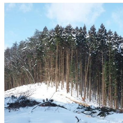
▲ 眠っていた山林の価値を引き出す

建築材や燃料材などの木材生産、山菜やきのこ、CO2 吸収や生物多様性の維持など…山や森は本来、私たちに沢山の価値をもたらす「資産」です。しかし私有林の多くが、適切な管理や活用がなされず放置されています。本プロジェクトでは、所有者の意向を受け、山林の現状把握と資産価値の評価・査定を行います。そのうえで、適切な活用方法の提案や山を必要とする企業などとのマッチングを行います。これらのサービスをワンストップで提供し、山林の活用・流通の活性化を図ります。