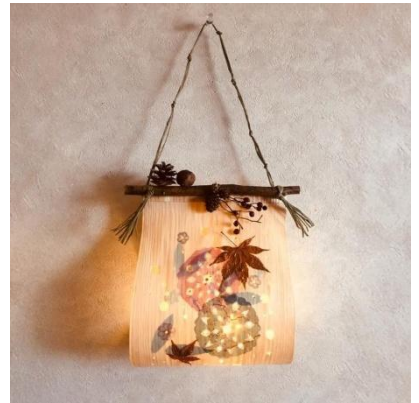
▲ 経木 (きょうぎ) を使った灯り