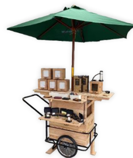
▲ イベントで活躍する木輪

盛岡市産材を活用した移動式販売什器「木輪（きりん）」を製作し、レンタル、販売します。飲食店などが出店するイベントにおいて統一された販売什器を使うことで、全体のデザイン性が一気に上がります。また、出店者は什器の持ち込みが不要となることで出店しやすくなり、さらには持ち込まれたテントタープが出店枠をはみ出して点字ブロックに掛かるトラブルも防げるため、イベント主催者、出店者、街ゆく人のみんなに優しいイベントとなります。この優しさ、温もりを伝える上で盛岡市産材を大いに利用し、良さを伝え活用へ向ける取り組みを行います。