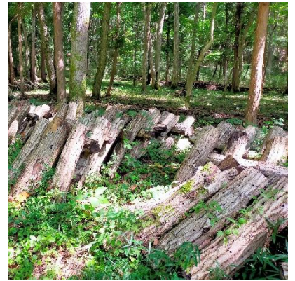
▲きのこの栽培から収穫まで体験できる

「Jiyuya Craft Forest」は、盛岡市松園・滝沢エリアから車で10分の「第2の庭」です。森林を人の手で整備し、生まれたスペースで多様な活動を提供します。間伐材の木工、山菜・キノコの栽培、薪ストーブを囲む交流、ウォーキングなど、森の恵みを「手作り」で体験できます。通年利用可能なスノーパークや、地域の人に参加できるクラフトマルシェも併設。会員制と時間料金制を組み合わせ、森林の楽しさを通じて地域に溶け込む新しいコミュニティ空間です。