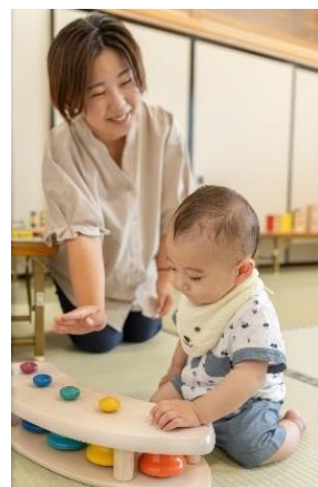
▲ おもちゃを通じた木との触れ合い

盛岡市内の森で育った木を利用し、赤ちゃんから大人までが、様々な形で長く楽しめる木製のおもちゃを製品化します。幼少期から実際の木と触れ合う経験を通じて、子どもたちの豊かな感性や想像力、森林への関心を促進するお手伝いできればと考えています。上質な家具のように、高いデザイン性と耐久性を備えることで、家族のライフステージに寄り添いながら、世代を超えて受け継ぐ価値のあるものにしていきます。