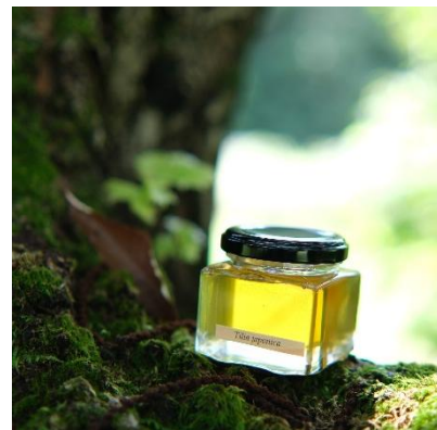
▲ 盛岡の樹々が育んだ天然のはちみつ

サクラ、トチ、クリ、シナ、ウルシ…。季節ごとに多様な樹々が花を咲かせる広葉樹林内にて「森の多様性を味わう」はちみつを生産します。蜜内の花粉からハチが訪れた植物を特定・表示。森の樹の多様性が見える商品とします。季節とともに花の構成も移ろい、はちみつの色や香り、味も変化。季節ごとの樹のハーモニーを楽しむことができます。先進知見や技術も活用し、化学薬品の抑制や残留農薬の検査、作業の負荷や安全性、ハチへのストレスや生態系への配慮にも取り組みます。