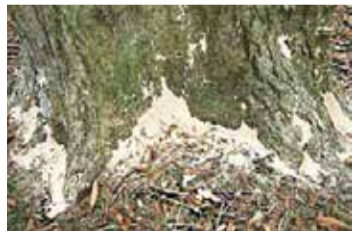
▲ナラ枯れしている樹木