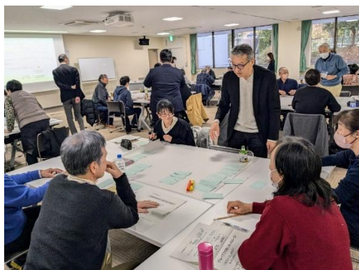
令和6年度リーダー研修会の様子