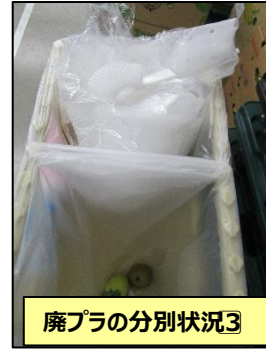
廃プラの分別状況③