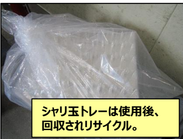
シャリ玉トレーは使用后、回収されリサイクル。