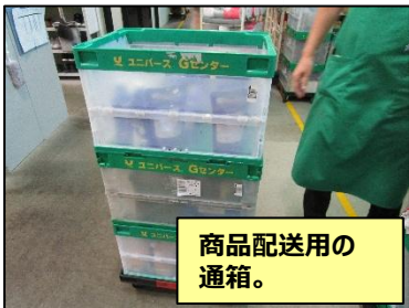
商品配送用の通箱。