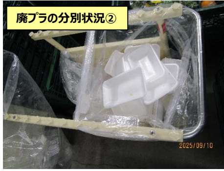
廃プラの分別状況②