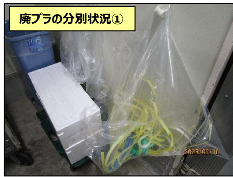
廃プラの分別状況①

一般廃棄物に混入しやすい、廃プラスチック（産業廃棄物）や古紙（OA用紙や雑紙など）について、専用のごみBOXなどを設置し、現場（部門）で手元分別されています。