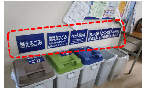
休憩室の分別状況。ごみの種別が分かりやすく明示しており、非常に効果的です。

資源・廃棄物の一時保管庫についても、ごみ種別と保管場所が明示されており、きれいに整理整頓されています。