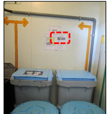
生ごみを含む一般廃棄物保管庫は全店舗、空調設置。臭いもコントロールされていました。