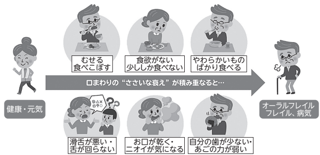
※オーラルフレイルQ&Aより引用 著者：平野浩彦、飯島勝矢、渡邊裕

お口のささいな衰えには、◆よくむせる、食べこぼしが多くなった、滑舌が悪くなった◆噛めないで食欲がわかない◆歯がないので柔らかいものだけ食べる◆お口が乾く、口臭が気になる等が挙げられます。