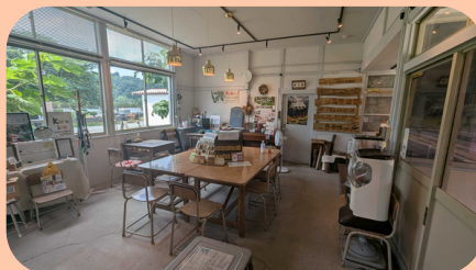
上米内駅舎内の待合カフェ

コースは山岸駅までですが、上米内駅まで 足を伸ばしてみたいはいかがですか! 山岸駅から上米内駅までは5キロ越えかつ 上り坂とかなり歯応えのあるコースです が、歩ききった先の上米内駅には漆工房や 無人カフェが併設しており、ゆっくり休む ことができます!(営業時間:9時~18時)