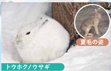
トウホクノウサギ