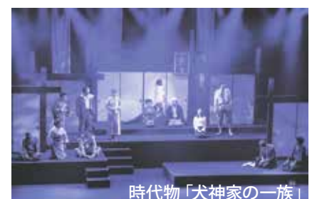
時代物「犬神家の一族」