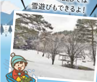
PICNIC FIELDでは 雪遊びもできるよ！