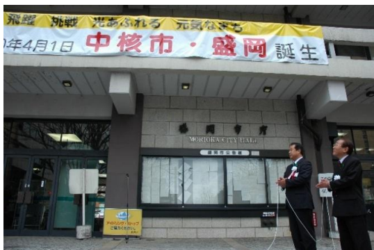
中核市への移行（平成 20 年 4 月 1 日）

さらに、市民参画や協働によるまちづくりを推進し、まちづくり懇談会や市民の意見箱などあらゆる機会を通じた市民ニーズの把握に努めたほか、新たに連携中枢都市圏 4 の形成を図るなど、広域的な連携を推進しました。