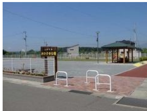
渋民地区公園整備事業