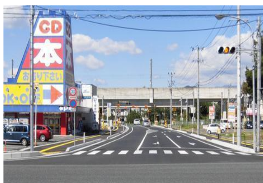
広域圏道路整備事業「市道谷地頭線」*