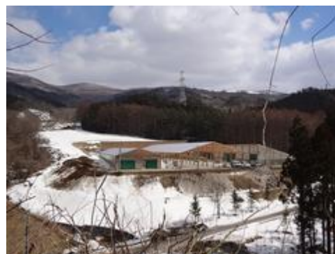
有機物資源活用センター整備事業* (ひめかみ有機センター)