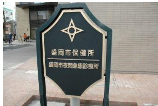
盛岡市保健所の設置(平成 20 年4月1日開設)

(主要施策 7 「健全な行財政運営と自治能力の向上」については、個別事業を位置付けていません。)