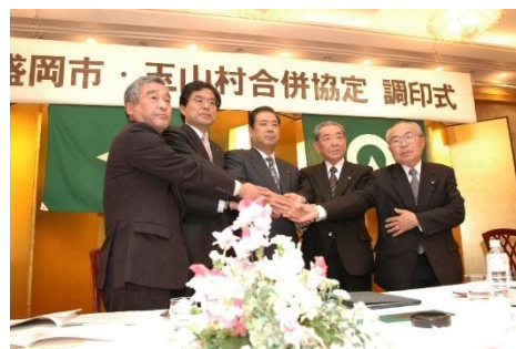
盛岡市・玉山村合併協定調印式