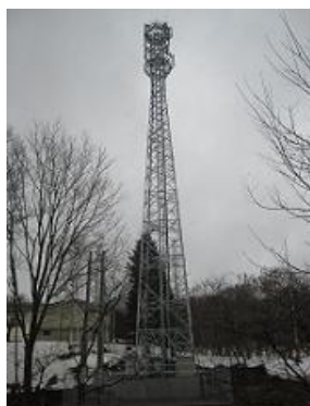
移動通信用鉄塔整備事業(岩洞湖地区・外山地区など)