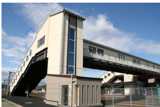
I G R 好摩駅周辺整備事業*

さらに、公共下水道や農業集落排水の整備を進めるとともに、公共下水道の早期整備が難しい地区においては浄化槽の設置を進め、生活環境の保全と公衆衛生の向上を図りました。