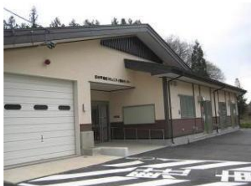
コミュニティ消防センター整備事業(釘の平地区)*