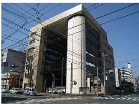
保健所設置事業(市保健所)*

加えて、老朽化が課題となっていた市営火葬場の建て替えを行ったことで、高齢化社会の進展による将来的な火葬需要に対応したほか、民間のノウハウを活用した運営により利用者への快適なサービスを提供できるようになりました。