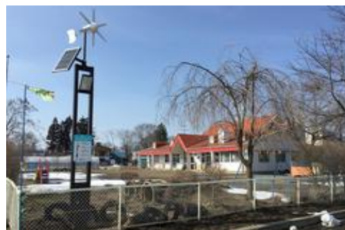
生出地域エコタウン事業★ (公共施設屋外照明灯の設置)