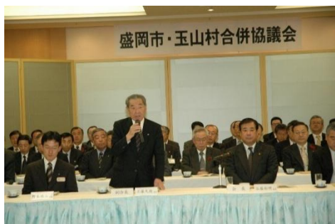
盛岡市・玉山村合併協議会の様子

このたび、令和6年度（2024年度）で計画期間が終了したことから、19年間の実施状況を振り返り、今後のまちづくりに生かすため、新市建設計画の総括を行いました。