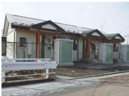
夏間木第1団地建替事業

また、川又の一般廃棄物処分場の再整備を行い、自然環境との共生を図りながら埋立面積を拡充し廃棄物の適正処理を進めたほか、玉山地域において情報集積が行われていなかった自然環境の保全や野生動植物の保護のための調査を行い、自然環境及び歴史的環境保全計画（生物多様性地域戦略）の改訂の基礎としたことに加え、生出地域エコタウン事業として、ユートランド姫神への太陽光発電施設の設置や公共施設へハイブリッド照明灯等を20基整備し、施設の省エネルギー化を推進しました。