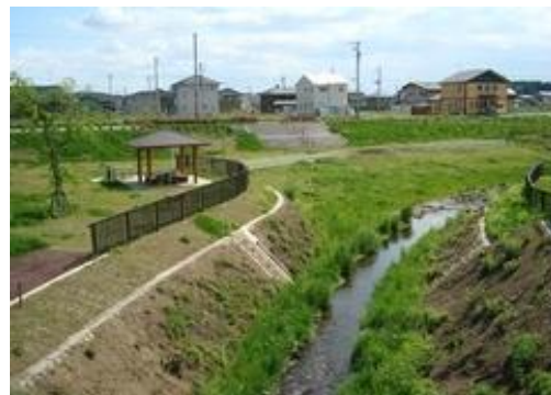
準用河川大橋川改修事業