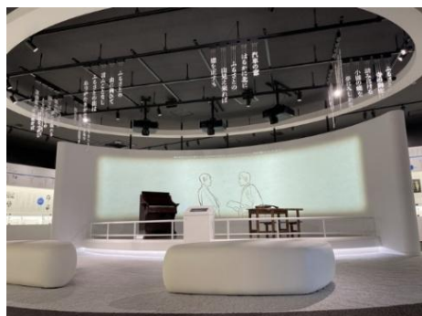
玉山歴史民俗資料館・石川啄木記念館整備事業*