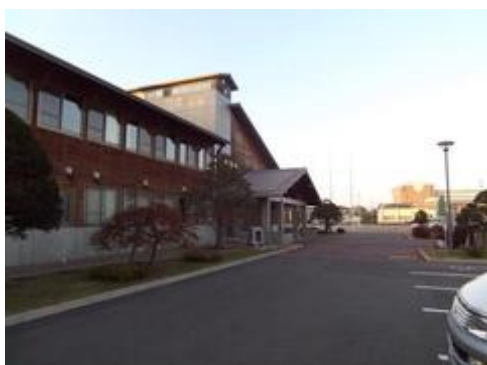
渋民小学校施設整備事業*

さらに、石川啄木をはじめとする先人の顕彰など芸術団体等が行う芸術文化活動の振興や、安倍館遺跡等の史跡環境整備など歴史文化遺産の保護を進めるとともに、石川啄木記念館と玉山歴史民俗資料館を複合施設として整備し、ふるさとの歴史を継承しにぎわいあふれる拠点づくりを進めました。