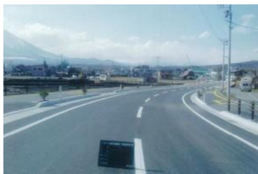
都市計画道路「渋民鶴飼線」*