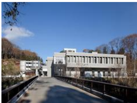
火葬場整備事業(盛岡市斎場やすらぎの丘)*