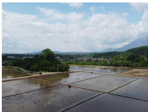
県営ほ場整備事業(武道地区)*