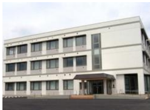
産業クラスター推進事業(産学官連携研究センター)*