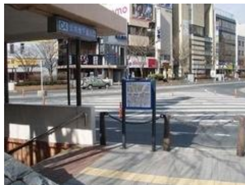
盛岡駅周辺地区バリアフリー整備事業