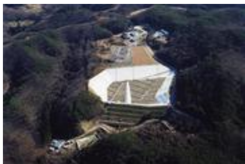
廃棄物処分場整備事業