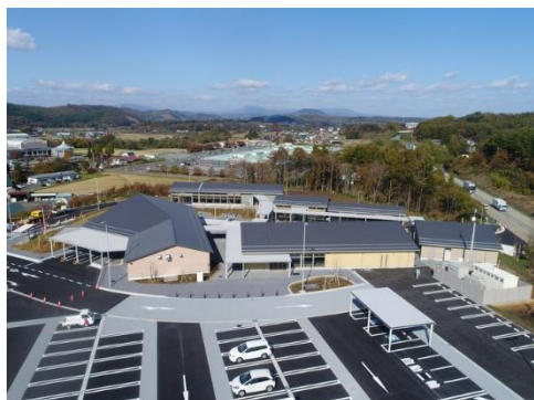
道の駅設置事業(道の駅もりおか渋民)*

さらに、生産基盤の整備を進め競争力のある農業の振興を進めたほか、蕨川地区の農村交流センターや玉山地区の有機物資源活用センターの建設を通じて、6次産業化への支援や循環型農業の展開を図るとともに、土砂災害の防止や水源のかん養、生物多様性の保全など森林の多面的機能を発揮するため森林の適正管理に取り組んだほか、地域産木材の利用拡大の推進や市有林造成事業を行いました。