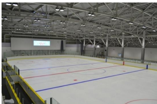
生涯スポーツ施設整備事業(市アイスリンク)*