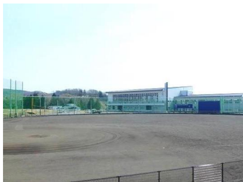
運動公園整備事業(渋民運動公園)*