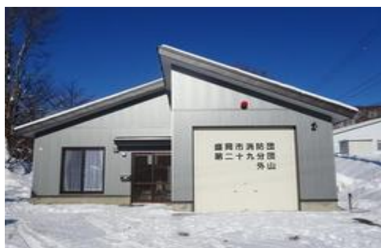
消防施設整備事業(消防屯所の更新)*