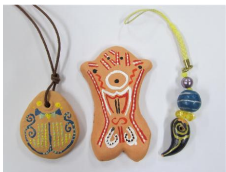
お守りネックレス、板状土偶マグネット、 古代風ストラップ