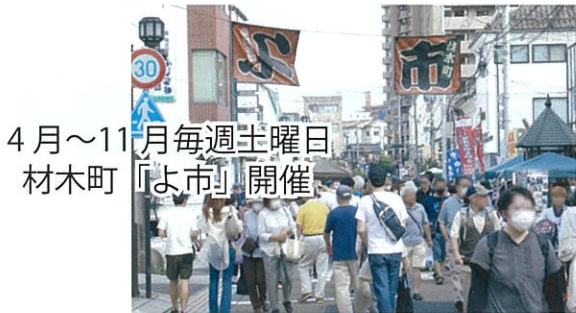
4月～11月毎週土曜日 材木町「よ市」開催

「光原社」1924年に創業者の及川四郎が宮沢賢治の童話集『注文の多い料理店』を出版する際、賢治自身が命名したものです。