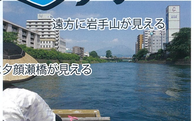
遠方に岩手山が見える