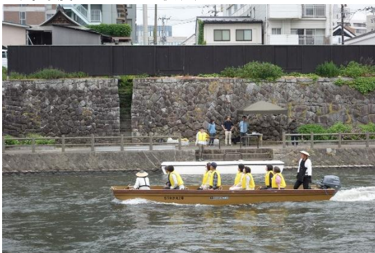
もりおか丸2号運航状況