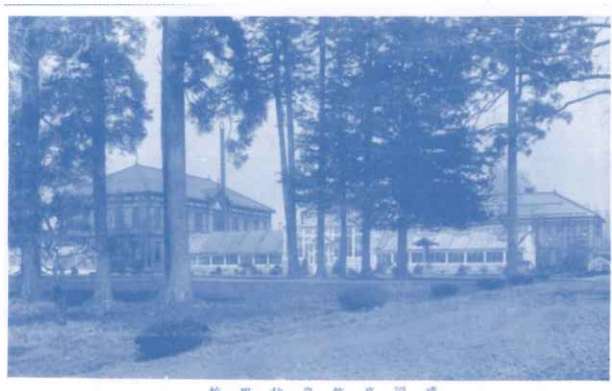
▲絵葉書「盛岡高等農林学校」