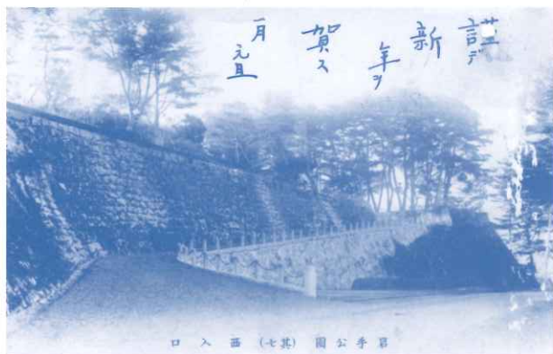
▲絵葉書「岩手公園西入口」

盛岡市内には、ゆかりのある人物の歌碑や句碑、銅像などが点在しています。また、盛岡銀行本店（現在の岩手銀行赤レンガ館）、盛岡高等農林学校本館（現在の岩手大学農学部農業教育資料館）といった歴史ある建造物も残されています。この展示では、文学碑や彫刻、それに関連する人物などを紹介します。