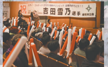
▲オリンピックのパブリックビューイングでは、多くの市民が地元から声援を送りました

これからも盛岡で競技に打ち込み、ここ岩手・盛岡から皆さんに笑顔で良い結果をお届けできるように頑張ります!