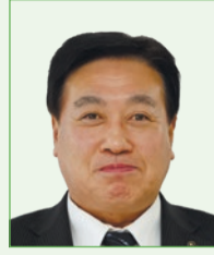
池野 直友 (公明党)

答 8年度は、市の計画などの案のパブリックコメント実施時に、子ども向け資料を作成する。今後も子どもの意見を尊重し、市政に反映する仕組みの構築と全庁の意識共有を進める。