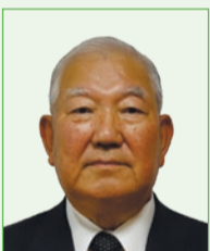
高橋 和夫 (日本共産党市議員)