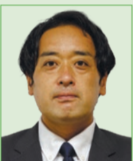
鈴木 努 (日本共産党市議団)