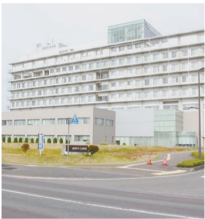
連携協定による患者の受け入れ

答 休日当番医は8年度から盛岡広域圏域で輪番で行う予定である。センター化については、市医師会と在り方について検討を行っている。