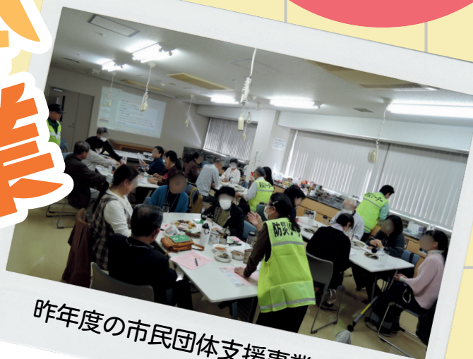
昨年度の市民団体支援事業の様子