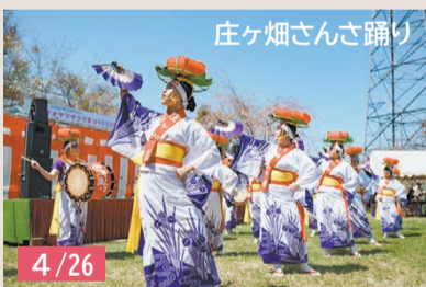
庄ヶ畑さんさ踊り