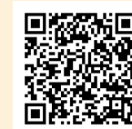
盛岡市防災マップ・防災ガイド

市は「防災ガイド」「防災マップ」を改訂し、令和8年2月に市内全戸に配布しています。防災マップで自宅や避難する場所を確認して、もしもの時に適切な行動ができるよう備えましょう。防災ガイドには、災害時に役立つ情報や日頃からの備えなどについての情報を掲載しています。