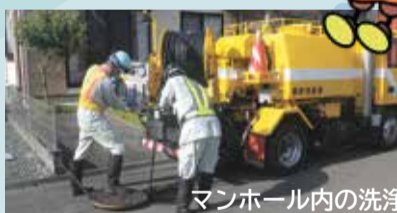
マンホール内の洗浄