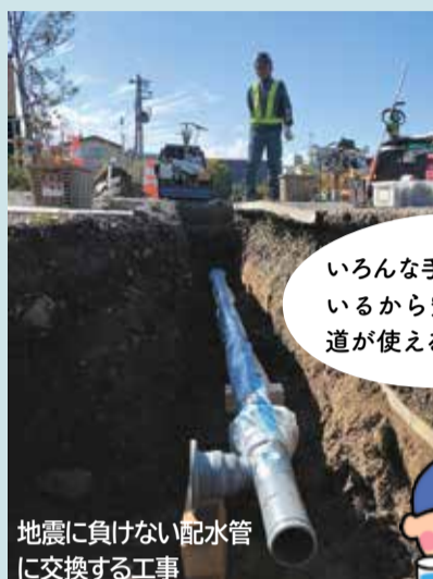
地震に負けない配水管に交換する工事

将来に向けた施設整備など 65億4000万円 過去の借入金の返済 3億7000万円