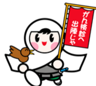
厚生労働省がん検診受診向上イメージキャラクター「けんしんくん」

<広 告> 広告掲載に関するお問い合わせは、ナチュラルコム㈱ ☎652-9190へどうぞ