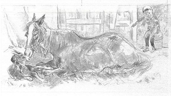
深沢紅子 ひるかお 水彩