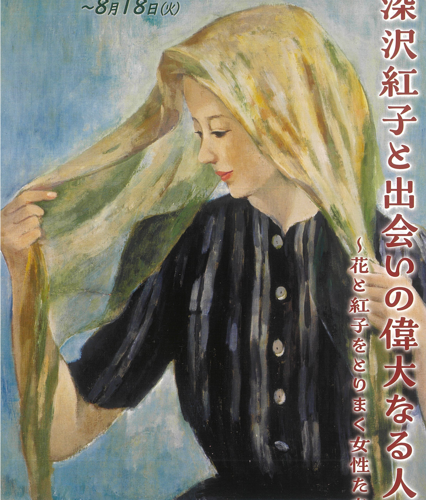
深沢紅子 スカーフの女 1941年

中津川のせせらぎセッション 初夏の風に音楽をのせて VARIETY SHIRT LIVES by THE NAKATU River