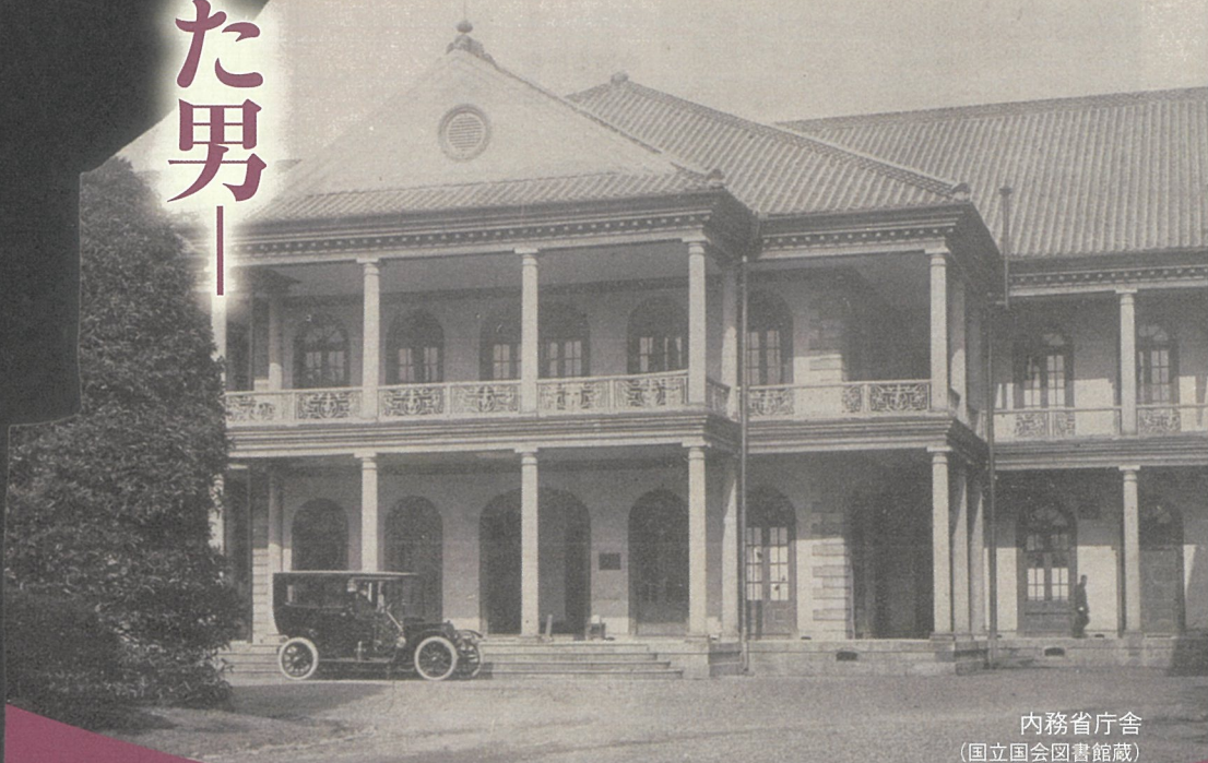
内務省庁舎 (国立国会図書館蔵)

令和8年6月13日(土) - 8月16日(日) 原敬記念館小ホール 企画展示コーナー